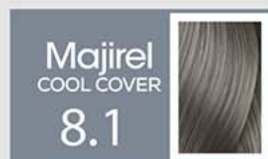
Rubio Claro Ceniza