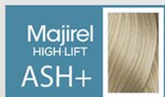
Super Aclarante Ceniza Profundo