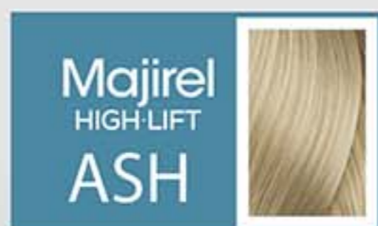
Super Aclarante Ceniza