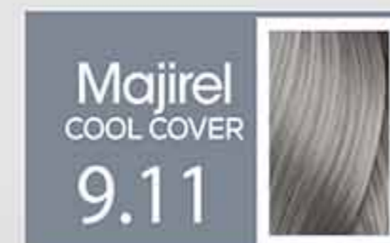
Rubio Muy Claro Ceniza Profundo