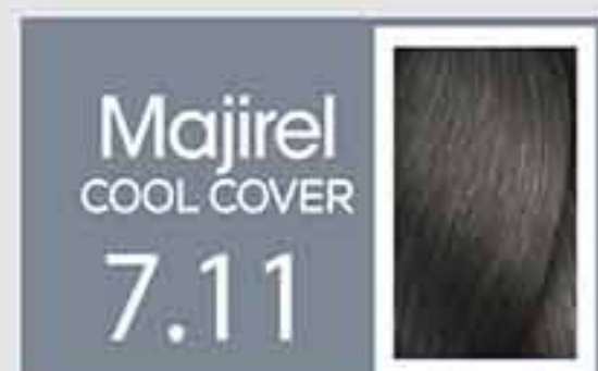
Rubio Ceniza Profundo