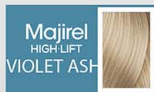
Super Aclarante Irisado Violeta