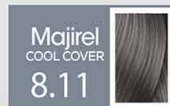
Rubio Claro Ceniza Profundo