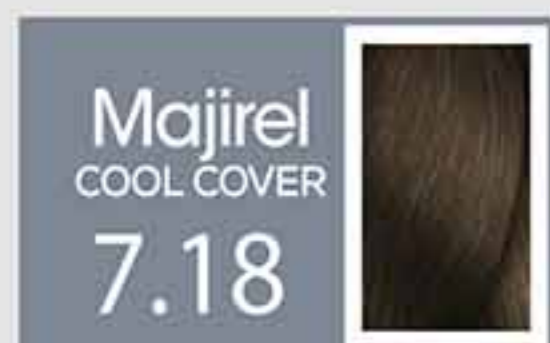
Rubio Ceniza Moca