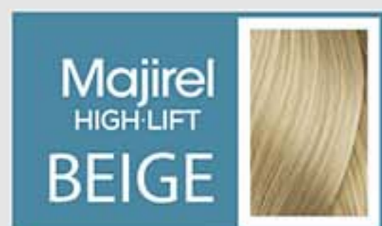
Super Aclarante Beige