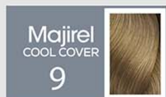
Rubio Muy Claro