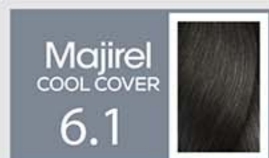
Rubio Oscuro Ceniza