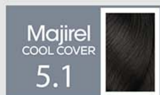
Castaño Claro Ceniza